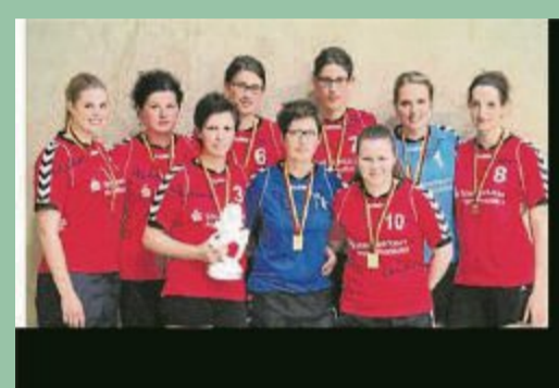
Im Jahr 2014 gewannen die Eisbergerinnen die Deutsche Frauenmeisterschaft im Korbball.

Der Hintergrund zu dieser Erfolgsgeschichte: Auf eine Anfrage aus dem Kalletal formierten vor heute 50 Jahren einige Eisberger Mädchen ein erstes Korbball-Schülerinnen-Team, das überraschenderweise bereits im Gründungsjahr bei den Westfalen-Meisterschaften im Feldkorbball in Herford mitmischte. Und 1989 nahm zum ers-