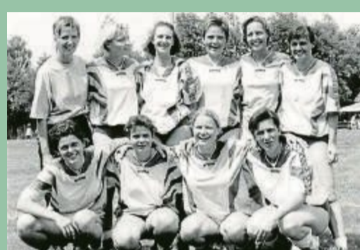
Im Jahr 1997 entschieden die Spielerinnen aus Eisbergen die Westfalenmeisterschaft für sich.

Der Turn- und Spielverein 1919 Eisbergen e.V. – kurz TuS Eisbergen – feiert in diesem Jahr sein 100-jähriges Bestehen. Ein Jubiläums-Highlight steht am Wochenende an und hat ein echtes Alleinstellungsmerkmal, weil es auf einer Sportart beruht, die heute Seltenheitswert besitzt. Denn der TuS unterhält seit einem halben Jahrhundert eine Frauen-Korbballabteilung. Und diese Korbballerinnen sind am Sonntag, 4., und Sonntag, 5. Mai, Gastgeberinnen der 51. Deutschen Meisterschaften dieser selten gewordenen Sportart.